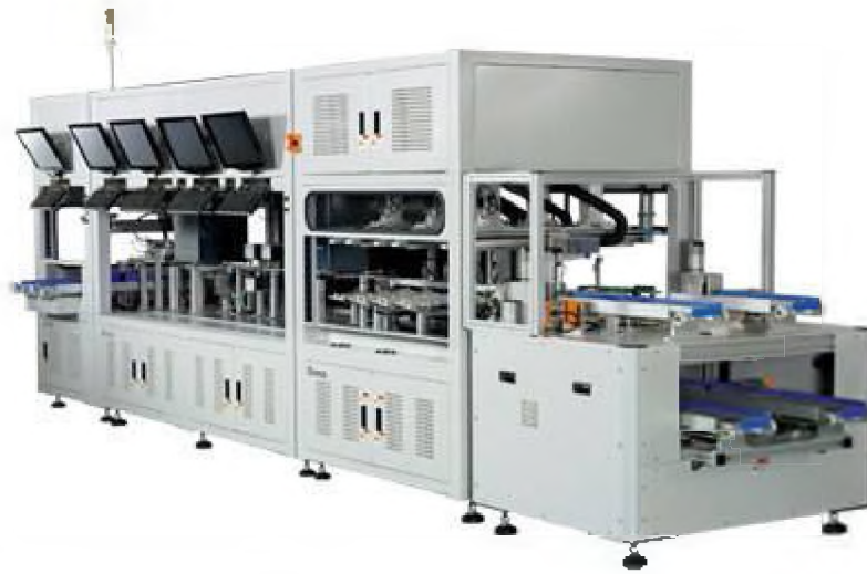
Solar Wafer Inspection System